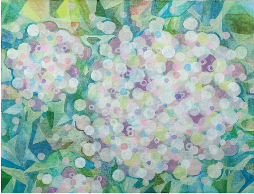
ピンクⅡ 油彩／キャンバス 35.3×46.3cm 2023年