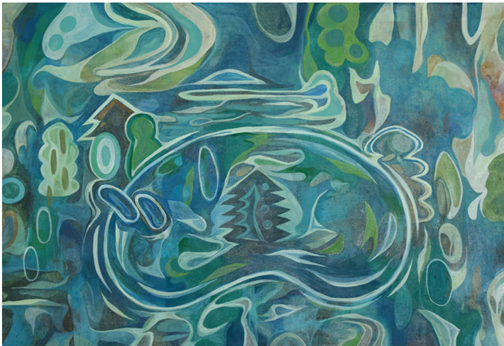
森を往くウミウシII