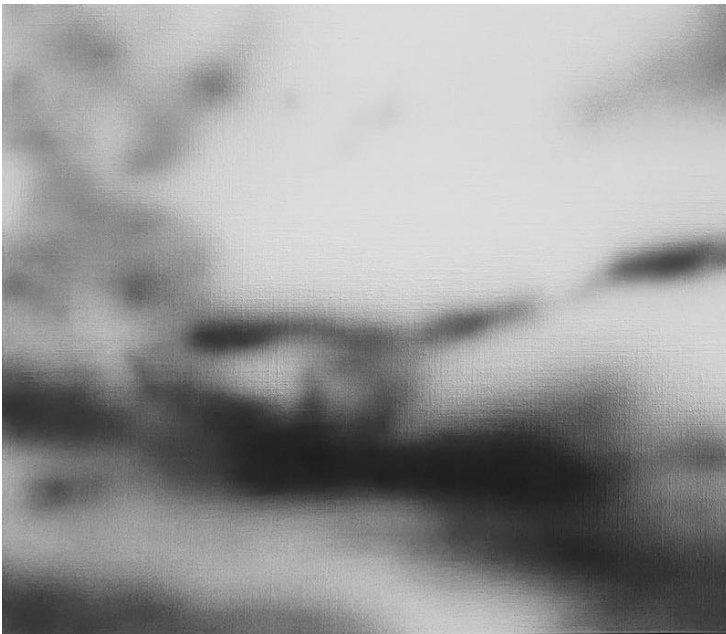
Out of Frame